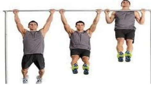
شكل (2) يوضح اختبار القوة المميزة بالسرعة

اجراءات الاختبار : من وضع التعلق على العقلة، يقوم المختبر بثني الذراعين إلى أن يصل الذقن أعلى من مستوى العارضة ثم مد الذراعين كاملاً .